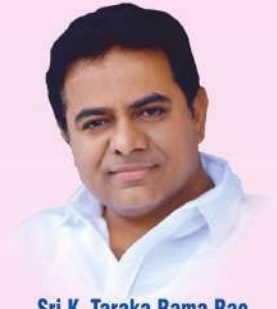
Sri K. Taraka Rama Rao Hon'ble Minister for MA & UD, Industries, IT & C, Govt. of Telangana