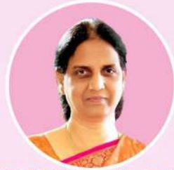
Smt. P. Sabitha Indra Reddy Hon'ble Minister for Education, Govt. of Telangana