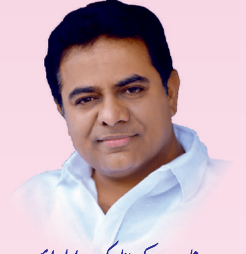
جناب کے تارک رامارائو عزت مآب وزیر آئی. ٹی. اینڈ سی. تلنگانہ