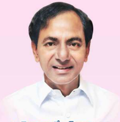
శ్రీ కె. చంద్రశేఖర్ రావు గారు తెలంగాణ రాష్ట్ర ముఖ్యమంత్రి