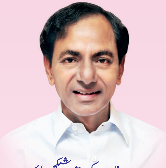
جناب کے چندر شیکھراؤ عزت مآب وزیر اعلیٰ تلنگانہ