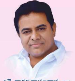
శ్రీ కె. తారక రామారావు గారు పురపాలక, పట్టణాభివృద్ధి, ఐటీ మరియు పరిశ్రమలశాఖామాత్యులు, తెలంగాణ ప్రభుత్వం