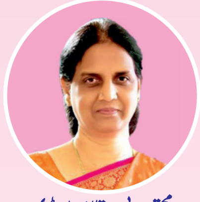
محترمہ بی. بیتا اندراریڈی عزت مآب وزیر تعلیم تلنگانہ