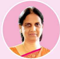
శ్రీమతి సజితా ఇంద్రారెడ్డి గారు విద్యాశాఖామాత్యులు, తెలంగాణ ప్రభుత్వం