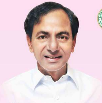
Sri K. Chandrashekhara Rao Hon'ble Chief Minister of Telangana